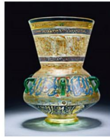
عناصر الاستخدامات اليومية